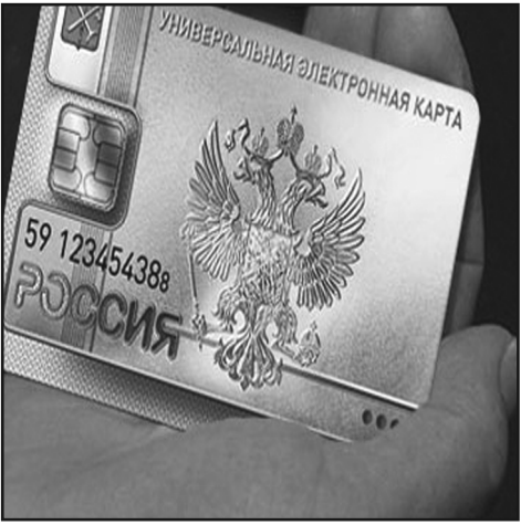
Универсальная Электронная Карта

Опасается и Медведев. Государство не нашло эффективных способов защиты персональной информации граждан, признал он на заседании Комиссии по модернизации. У Грефа и Дворковича уже есть идеи — например, идентифицировать наши личности при помощи отпечатков пальцев (как это делается в Европе). Но